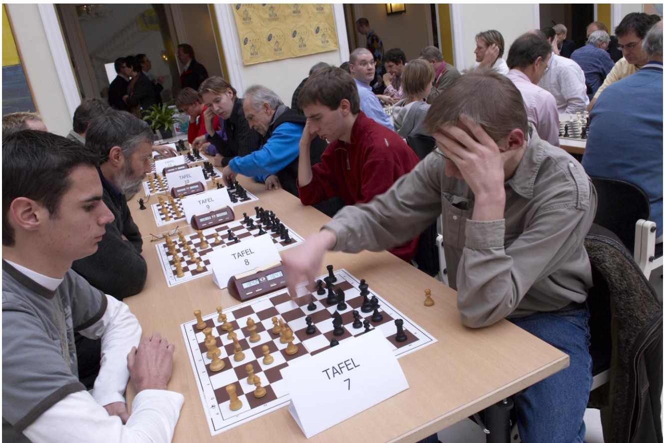
Verwoede strijd om de titel en het prijzengeld